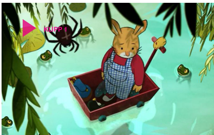
Klipp 1