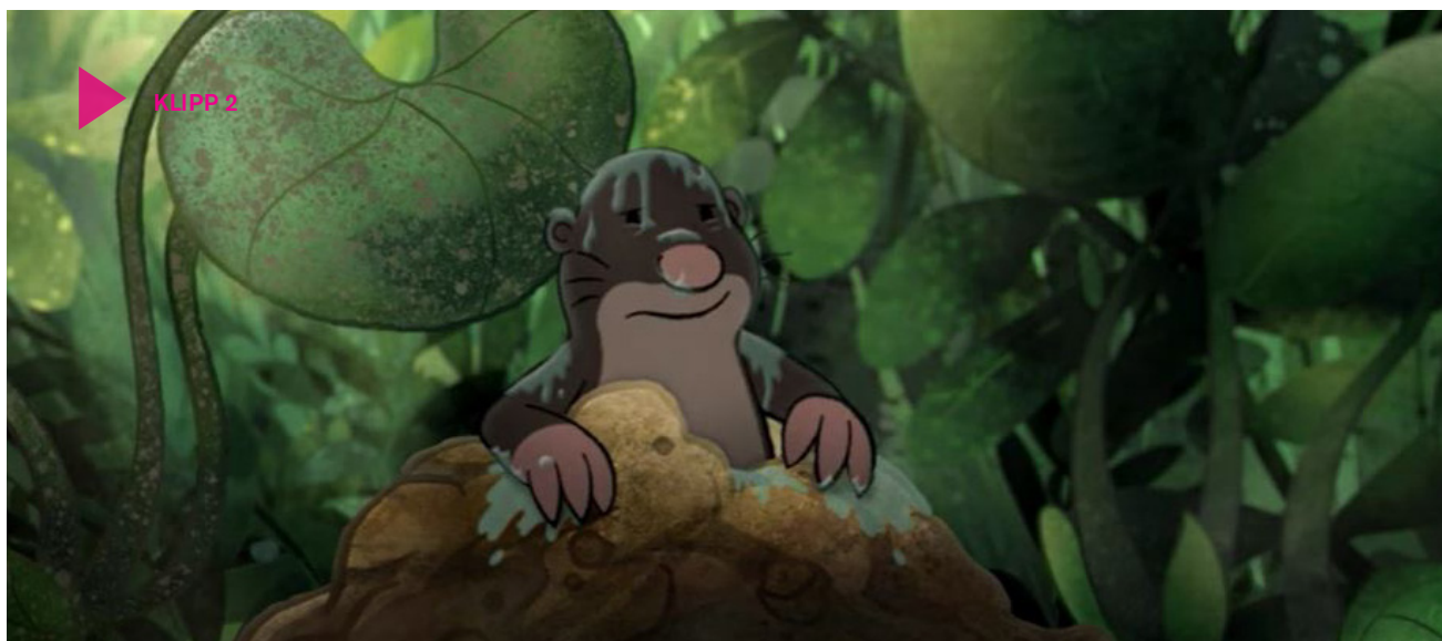
Klipp 2

Ett centralt mål i grundskolans läroplan är ”sortering och gruppering av växter och djur samt namn på några vanligt förekommande arter”. Kalle träffar på många djur och växter i skogen, som vi kan känna igen i vår egen natur. Titta på klipp 2 : ”Djuren i skogen”.