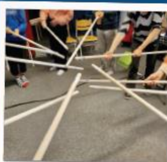
SAMSPEL MED KVASTAR