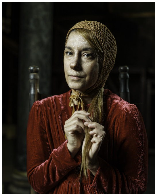
Ofelia (Hamlets bästa vän)