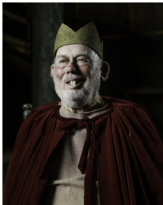
Hamlets nya dumma pappa