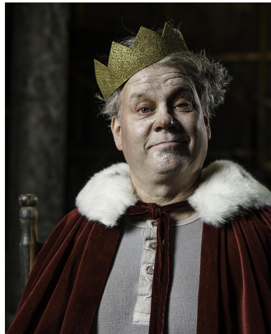
Hamlets döda pappa