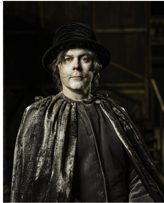
Ofelias skumma pappa