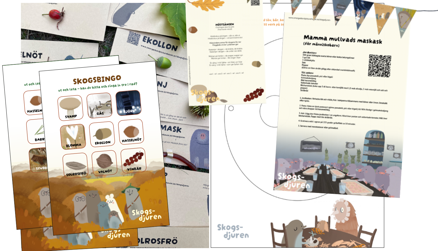
Skogsbingo, maskpyssel, vimpelverkstad, sång – och förstås: Mamma mullvads maskask!