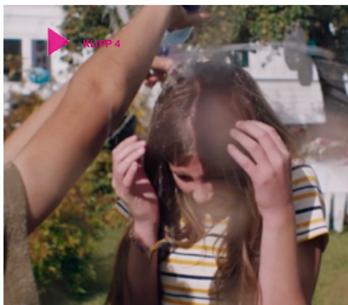
Klipp 4

• Intervjua varandra två och två eller i mindre grupper. Hur är bra vuxna? Hur är en bra förälder och hur är en bra lärare? Hur ska vuxna vara för att ni ska våga och vilja vända er till dem när ni behöver hjälp eller stöd eller kunskap om något? Vilka andra vuxna finns det i era liv än föräldrar och lärare? Vet ni andra ställen där man kan få stöd av vuxna?