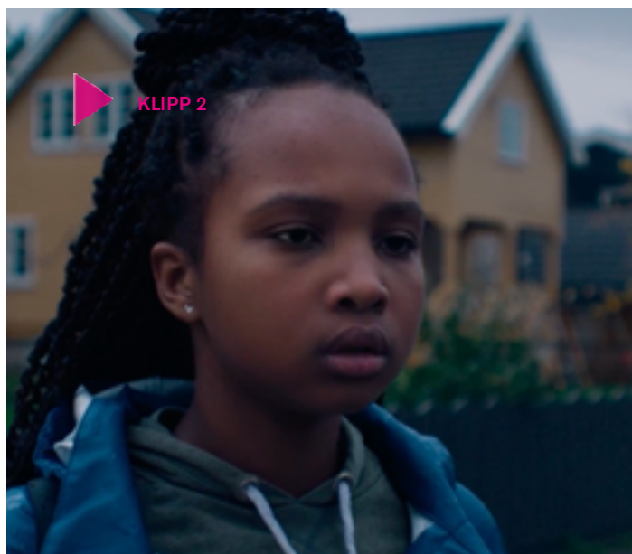
Klipp 2

• Se klipp 1 . Gör en dramaövning i mindre grupper (3-4 personer) där ni hittar på ett par trollformler och gestaltar dem. Visa för varandra i klassen!