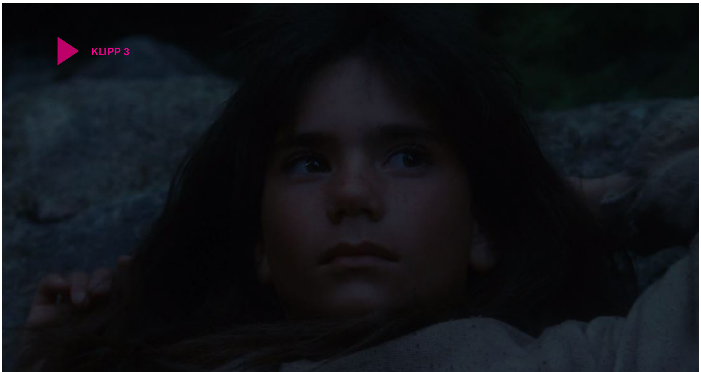
Klipp 3

Att berätta om kusligheter och skräck är erkänt svårt bland såväl författare som filmare.