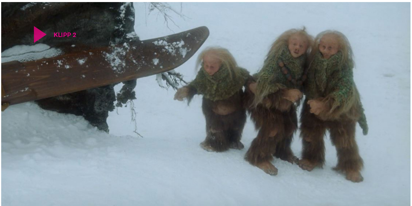
Klipp 2 Källa: SF

Titta på klipp 1 för att påminna er om scenen.