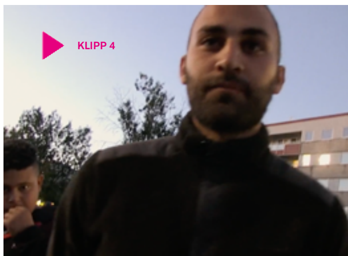
Klipp 4

• Gör en individuell skrivuppgift och reflektera kring begreppet identitet. Vilka omständigheter, människor och platser i ens liv påverkar ens identitet? Är kön, sexualitet, etnicitet och liknande kategoriseringar verkligen det som vi själva upplever som vår identitet ”inifrån”? Vilken roll