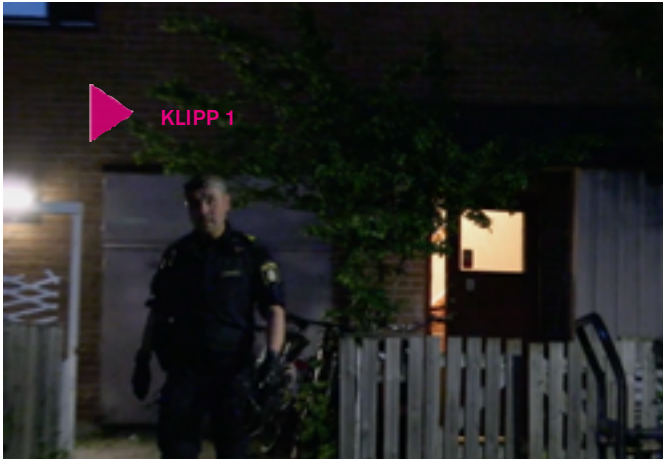
Klipp 1

ihop filmen. De är knutna till varsin person. Vilka är trådarna? Vad berättar klippen och kollagen som visas när vi får höra Lorans telefonsamtal med sin fru? På vilket sätt är de annorlunda än resten av filmen? Vad ger det er för tankar och upplevelse att samtalen med Björnen ibland ligger som voice over över andra bilder, till exempel olika allmänna klipp som gestaltar förortsmiljön?