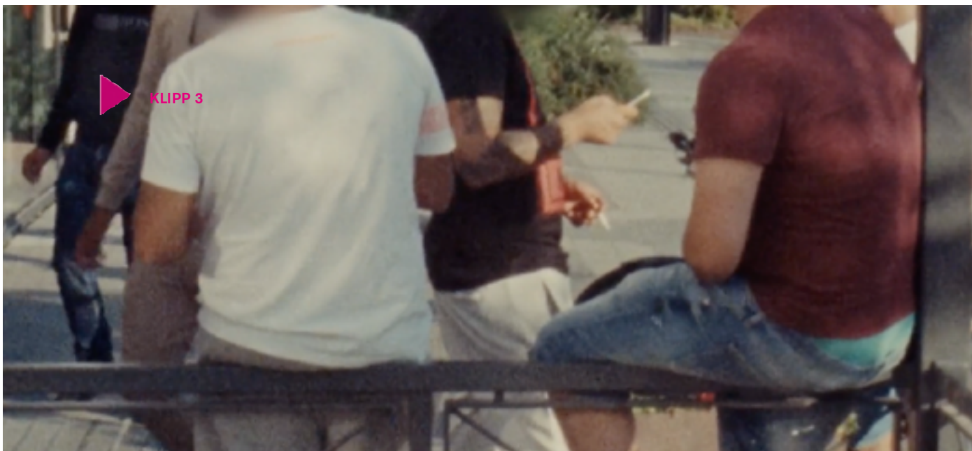
Klipp 3

tet, klass, kön och så vidare – sker på basis av en sorts kontrastprincip: utländsk får sin betydelse genom att det kontrasteras mot svenskhet, barn utgör den grupp som inte är vuxna, sjuk är den som avviker från vad som i ett visst sammanhang räknas som friskt och kvinna blir den som inte kan kategoriseras som man.