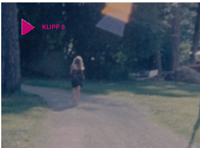
Klipp 5

spelar sådant vi varit med om, och de människor vi delat olika upplevelser med, för vår identitet? Är identitet och personlighet nödvändigtvis en gång för alla fastslagna tillstånd och uppfattningar om oss själva, eller hur kan de förändras? Vad spelar omvärldens syn på oss och reaktioner på våra val och beteenden för roll för vår känsla av identitet?