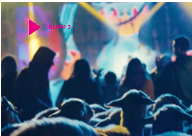
Klipp 3

på det här sättet? Vem ”vinner” och vem ”förlorar” på de här strukturerna och traditionerna? Vad betyder fri vilja i de här sammanhangen?