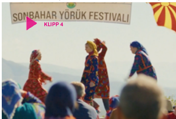
Klipp 4

• Diskutera också om religion kan ses som en form av kultur, eftersom den ofta innehåller både konstnärliga uttryck som musik och bildkonst och traditioner som även knyter an till den icke-religiösa sfären i samhället (till exempel i